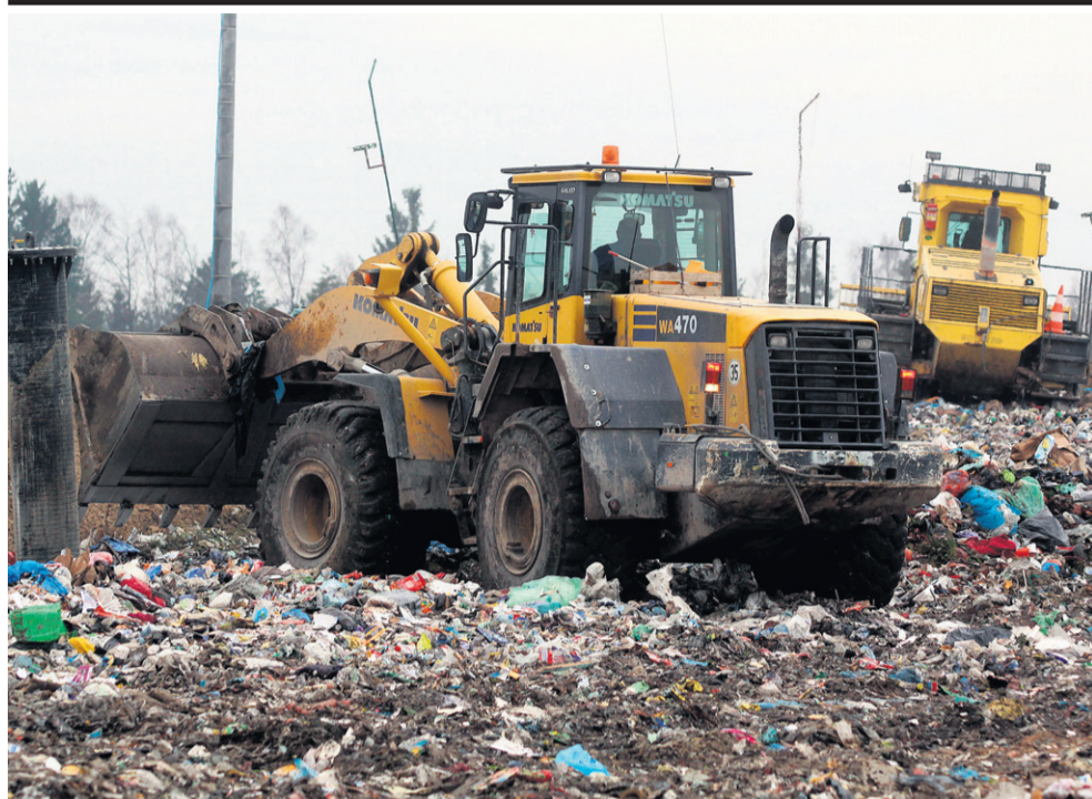
Coraz więcej odpadów, zamiast na mało estetyczne kwatery, trafiać będzie do sortowni