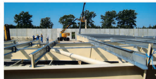
Kompostownia – plac budowy

tym, gdzie odpowiednie systemy będą kontrolować temperaturę i wilgotność, zraszać odpady, zasysać i odprowadzać powietrze do systemu biofiltrów. Kolejna faza procesu polegać będzie na dojrzewaniu kompostu w przyzmacz na istniejącym placu kompostowni. Obecnie trwa montaż konstrukcji hali kompostowni, zakończono fundamentowanie i ściany oporowe. Kolejną ważną inwestycją związaną z odzyskiem odpadów, zwłaszcza odzyskiem surowców wtórnych, jest rozbudowa sortowni odpadów. Obecnie pracująca sortownia ma przepustowość 50 000 ton/rok. Po rozbudowie będzie miała przepustowość 100 000 ton/rok. Budynek sortowni jest już rozbudowany, trwa montaż urządzeń linii technologicznej do sortowania odpadów.