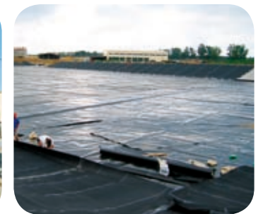
IZOLOWANA KWATERA SKŁADOWA