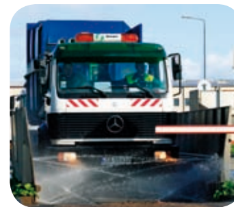
WAGA Z MYJKĄ