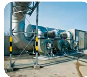
NOWA KOMPOSTOWNIA HAŁOWA